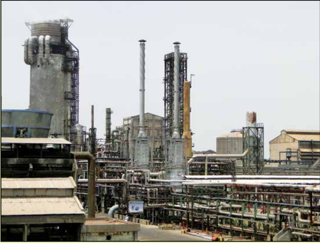
मद्रास फ़र्टिलाइज़र्स लिमिटेड, मणलि संयंत्र Madras Fertilizers Limited, Manali Plant