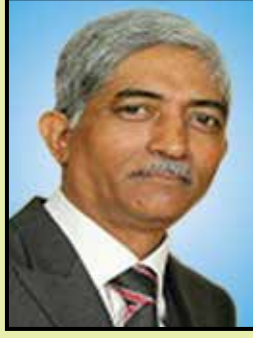
ए बी खेर